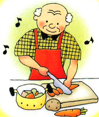
男性高齢者の調理講習会