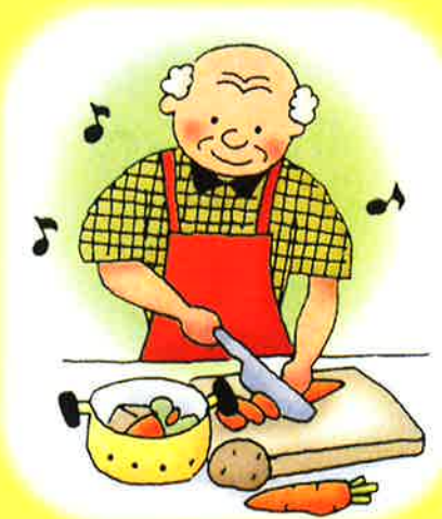
男性高齢者の調理講習会