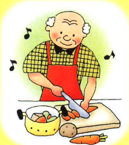
男性高齢者の調理講習会