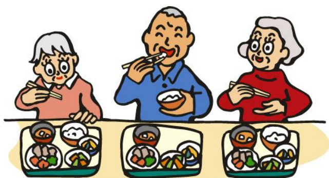
ひとり暮らし高齢者 ふれあい会食事業