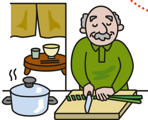
男性高齢者の調理講習会