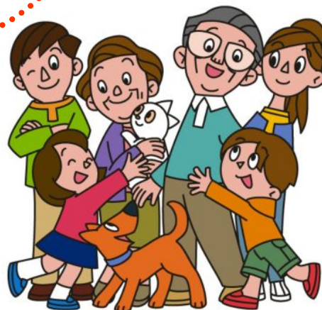
地域のふれあい推進事業など