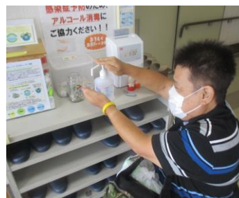
しっかりと塗りこみます！