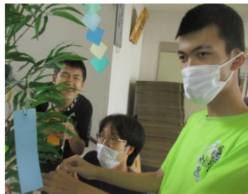
なんて書いたの？気になる～