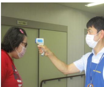
3秒で測れちゃいます！早っ！

★雀の宮作業所においても、検温・手洗い・アルコール消毒・うがい・換気などを行っています★