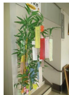
短冊の重さで倒れそう～