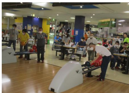
球をきれいに拭いて準備万端！

今後も、新型コロナウイルス感染の状況などを鑑みながら、可能な範囲で利用者みなさんのレクリエーションやリラクゼーションの機会をつくっていききたいと思います！