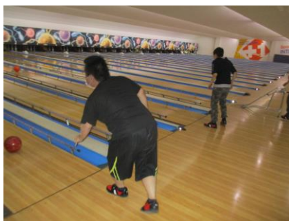
しっかり狙いを定めて、それ～