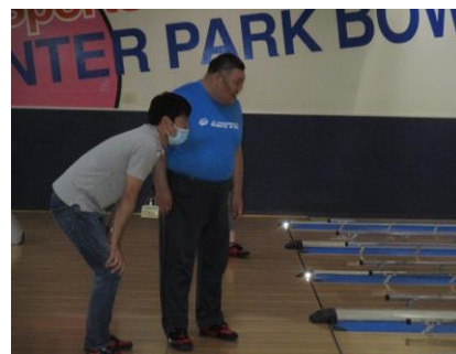
さあどうぞ！全部、倒れてくれ～