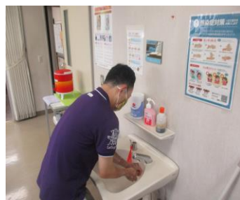
指のまた・手首まできれいに！