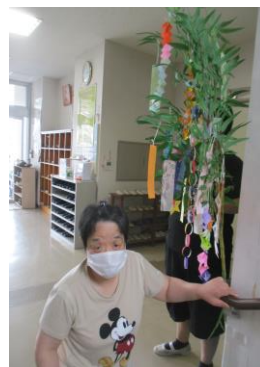
願いがかなうといいね！