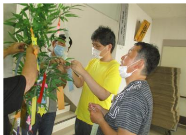
短冊に色々な「願い」を込めて！