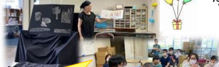
【7月4日(火)】 「おはなしの森」さんの協力 により、七夕の読み聞かせ や歌を楽しみました。

猛暑にも負けず、たくさん さんのチャレンジ！たく 令和5年度も早いも のでもう半分が過ぎま した。今年も記録的な 猛暑となりました。な みんないよいよ暑いこ なく、仕事やいろいろな 活動にがんばりまし た。日光にある障がい者 施設との交流、七夕な どの季節行事、ボランティア の季節行事、協力をして たいアさんの初め チャレンジしたら、絵手紙の 紙、体操などでスポーツの 秋の満喫など、ふり返つ ての思い出を返つ