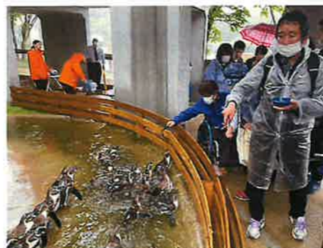
▲エサにたくさんのペンギンが！