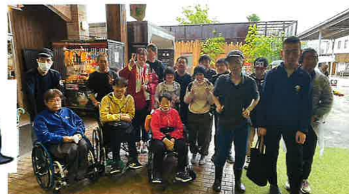
▲いろんな動物を見て、おみやげもたくさん買いました！

「雨でも楽しく！」「那須どうぶつ王国」 今年度最初の行事は、那須どうぶつ王国へ出かけました。園内には、様々な動物が飼育されており、子供達から大人まで大勢の観光客が訪れています。園内には、動物の餌やり体験や、動物のふれあい体験など、様々なアクティビティが用意されています。また、園内には、様々な種類の花や草花が咲き誇っており、美しい景色を楽しむことができます。那須どうぶつ王国は、家族連れやグループでの観光に最適な場所です。