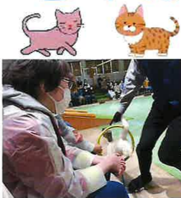
▲目の前で猫がパフォーマンス

令和6年6月14日 発行第44号 社会福祉法人 宇都宮市社会福祉協議会 地域活動支援センター 雀の宮作業所 〒321-0133 宇都宮市新富町15-25 TEL/FAX (028) 655-4091