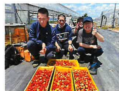
▲暑さに負けず、たくさんのイチゴを収穫