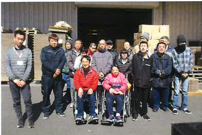
▲社長さんと一緒に工場の前でパチリ！「仕事頑張りますね！」