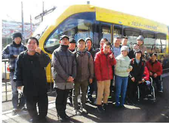
▲次世代の路面電車は快適な乗り心地！