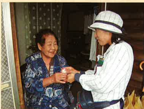
ヤクルトレディさんが訪問いたします。