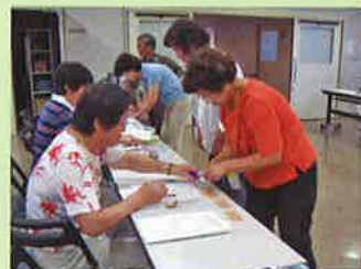
▲災害ボランティア養成講座