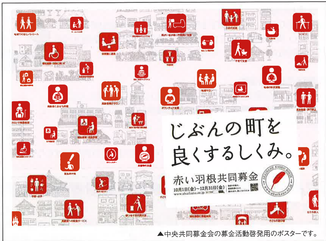
▲中央共同募金会の募金活動啓発用のポスターです。