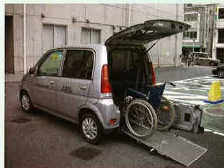
貸出車両の一例です