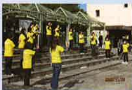
手話コーラスの様子

宇都宮市民福祉の祭典実行委員会(宇都宮市社会福祉協議会内) 宇都宮市中央1-1-15 宇都宮市総合福祉センター 電話: 636-1215