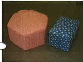
牛乳パックの椅子