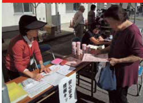
▲ 福祉協力員による安心・安全情報キットの配付