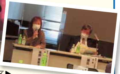
細谷・上戸祭地区▶