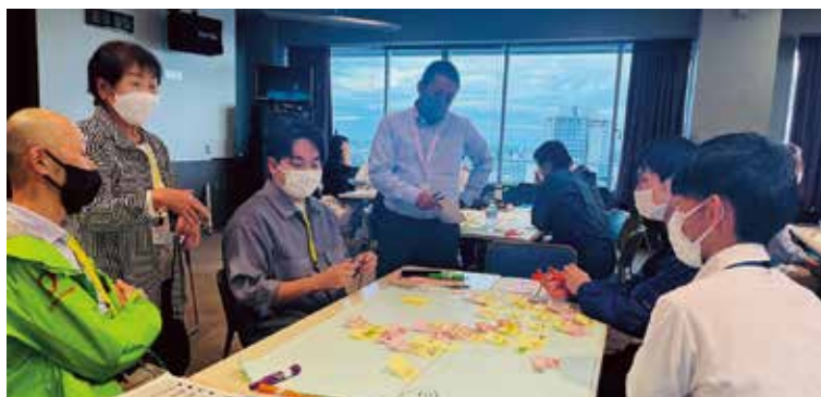
▲災害ボランティアセンター運営訓練：被災住民からの相談を受ける「市民ニーズ班」