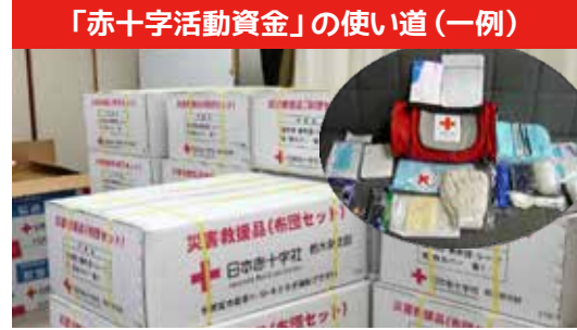
▲ 災害や火災等で被災した方への救援物資