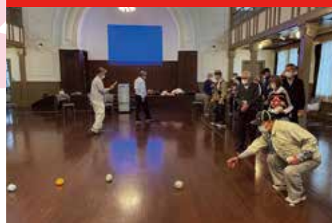
▲ 城東地区 宇大西ふれあいクラブ