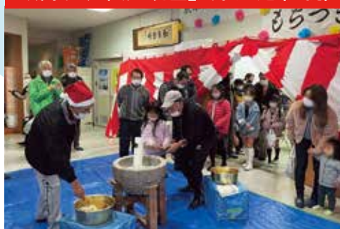
▲ 富士見地区 歳末たすけあい おたのしみもちつき大会