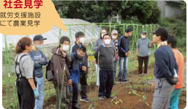
※畑のお仕事について勉強中!