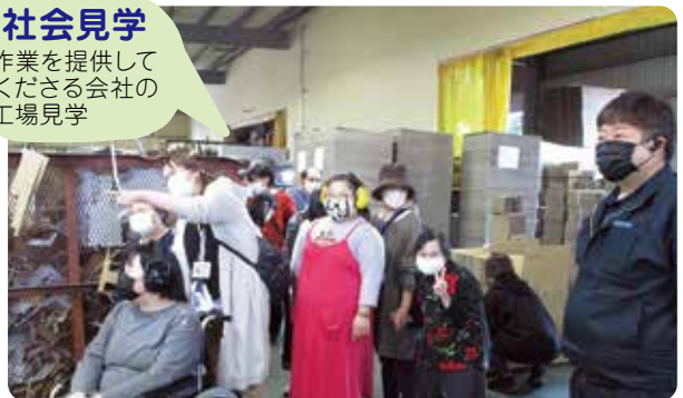
※会社の一員としての自信と喜びを実感!