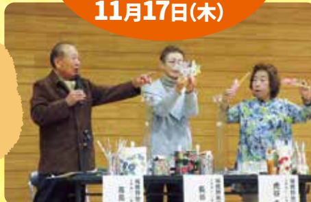
▲ふれあい・いきいきサロン瑞穂台