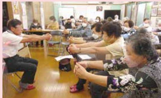
姿川地区 鶴中サロン