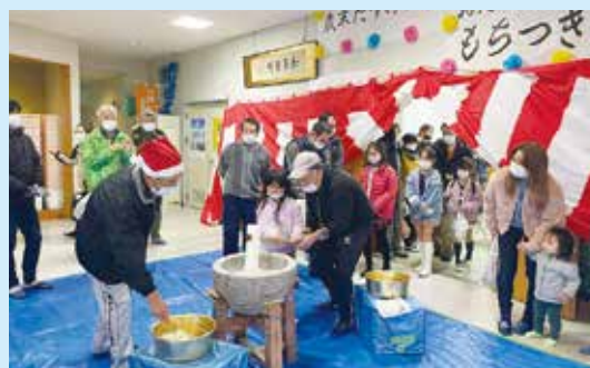
富士見地区社会福祉協議会