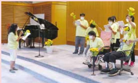
(一社) 栃木県手をつなぐ育成会