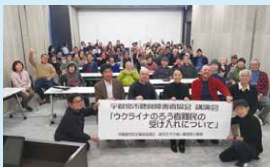
宇都宮市聴覚障害者協会