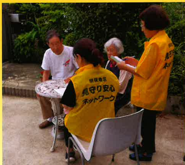
▲福祉協力員による見守り活動